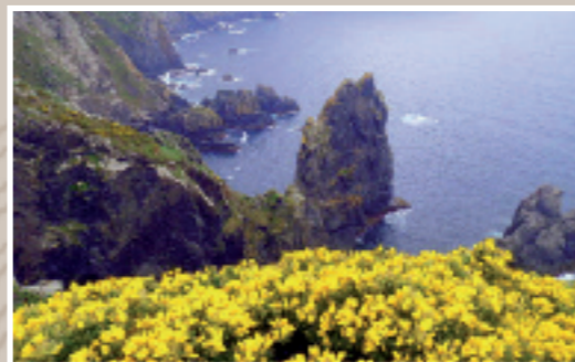
S. Andrés de Teixido (Coruña)