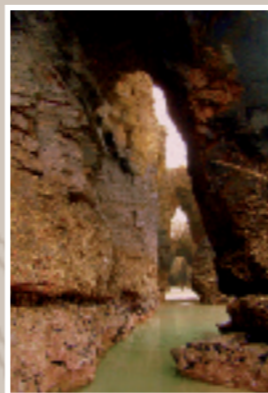
Praia Catedrais. Barreiro (Lugo)