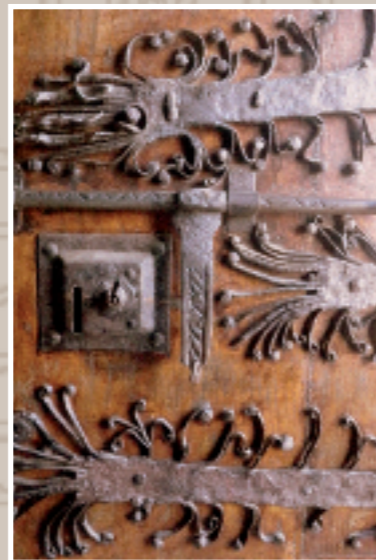
Sta. Mª de Meira (Lugo)

O tema é o estado da cuestión do Patrimonio Cultural de Galiza.